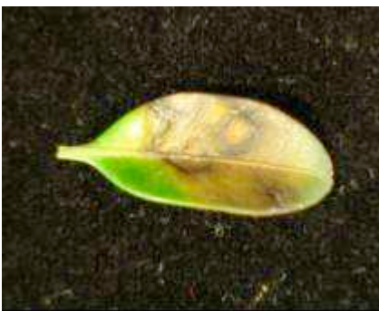
Brauner Flecken auf Buchsblatt