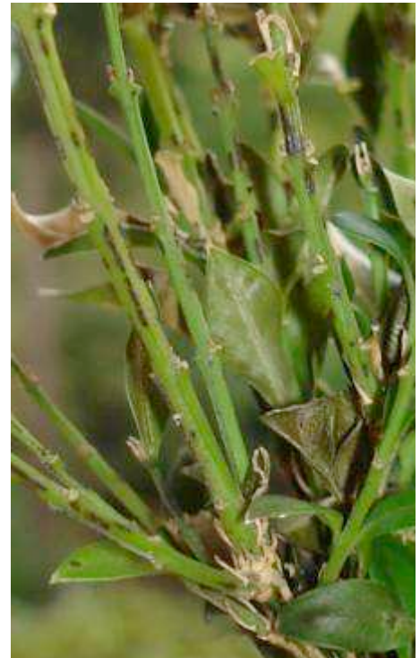
Schwarze Streifen auf den Trieben