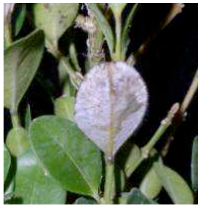
Weißer Sporenrasen auf der Blattunterseite